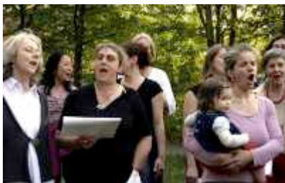
Wo mensch jodelt, lass dich ruhig nieder...

Entgegen der landläufigen Meinung ist Jodeln nicht auf die Alpen beschränkt. Gejodelt wird auf der ganzen Welt: auch in Neukölln gibt's einen Chor-nix wie hin!