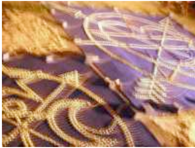
Zeichen+Wunder (2009)

Eine "yard show" in afroamerikanisch-neuköllnischer Tradition, die zum Mitgestalten einlädt. (Installation aus Abfallmaterialien; Fotos, Texte)