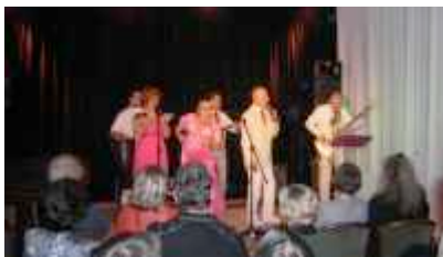
EHKF in action im Kulturhaus Mitte

Die Band "EinHundKleinfamilie" bringt selbst geschriebene und arrangierte Musik von Ballade bis Pop - deutsche Texte von ernst bis "durchgeknallt".