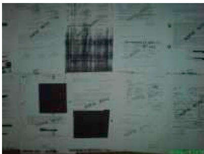
Akteneinsicht: mehr schwarz als weiß

Ostler und Westler, Frauen und Männer verschiedener politischer Haltung oder religiöser Bekenntnisse werden etwas aus ihren Akten vortragen.