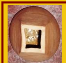
Quadratur des Kreises